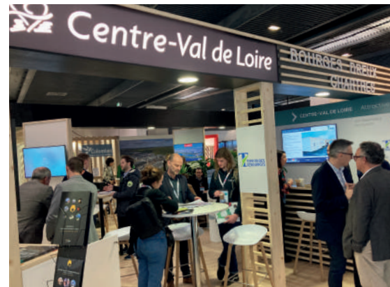
▲ Salon SIMI 2022