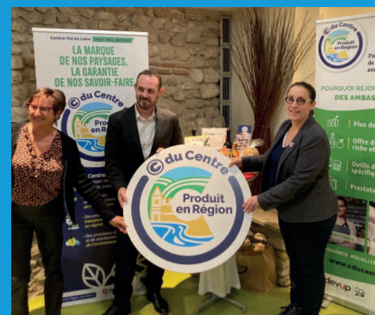
▲ Lancement du réseau Ambassadeurs