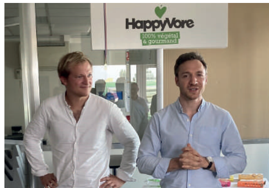
▲ Implantation HappyVore à Chevilly (45)