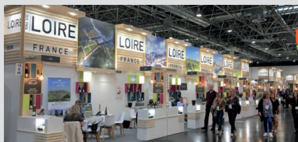
◀ Prowein Düsseldorf - 2022