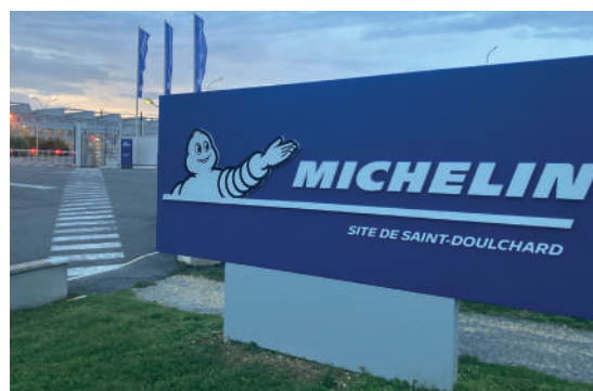
▲ Installation d'AirCaptif (groupe Michelin), à Bourges-Saint Doulchard (18)