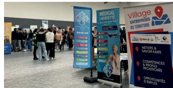
▲ Village d'entreprises de Chabris