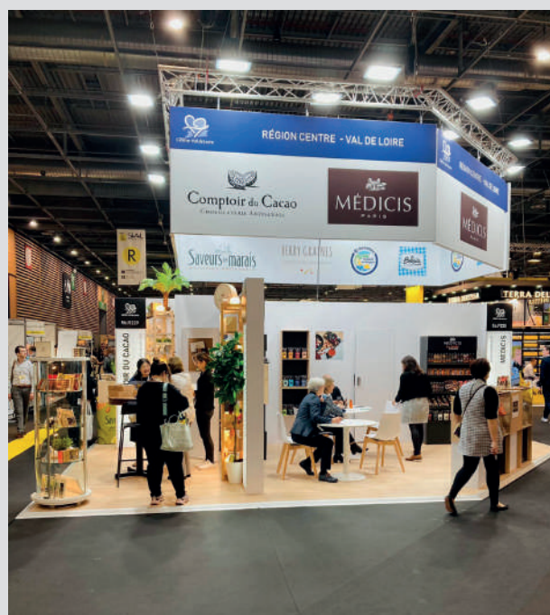
◀ SIAL Paris-Nord Villepinte - 2022